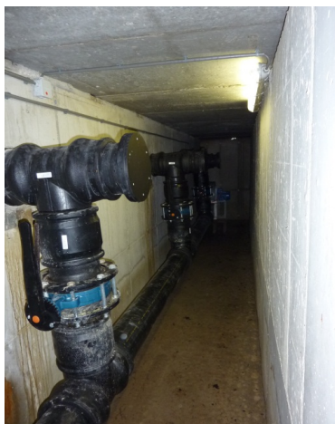
En af de to 2,2 kW blæsere som belufter den 100 meter lange stald. Fordeling af indblæsningsluften til 8 rør. Hver blæser forsyner 4 rør.