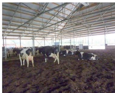
Løs, fjedrende og blød komposteringsmåtte.