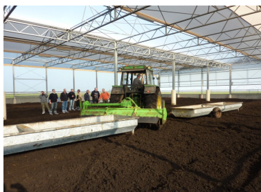
Foderkasserne manøvreres til deres nye plads ved hjælp af en krog på fræseren. Der fyldes frisk foder i alle foderkasser.