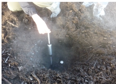
En måling af NH 3 -emission i et "hul" i en bunke isoleret kompost viste > 20ppm ved 60 °C.

Noget flis/kompost var skrabet af, fordi måtten var blevet for våd, det lå i en bunke i enden af stalden. Måling, i et "hul" vi gravede i bunken, viste > 20 ppm NH 3 og 60 °C.