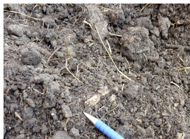
Færdigkomposteret kompost – er jord!