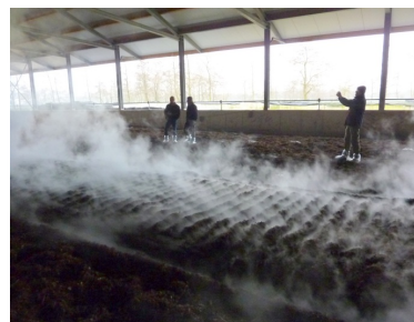
Fræseren efterlader et fint mønster, som damper et stykke tid efter.