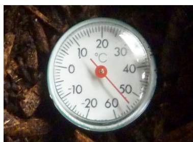
Ved besøget blev der målt 55 °C i 30 cm dybde.