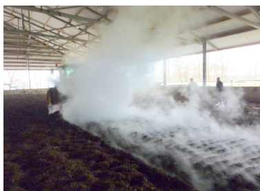
Voldsom frigivelse af kondenseret vanddamp ved fræsning. Vandrette ventilatorer (propeller) i loftet, trækker dampen op og ud af stalden, samt medvirker til at tørre måttens overflade.