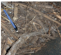
Meget grov flis.