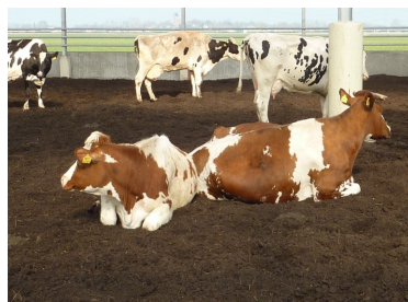
Drivhus-designet gjorde stalden meget lun, lys og venlig på en solskinsdag. Køerne var pæne og rene efter to uger i kompoststalden.