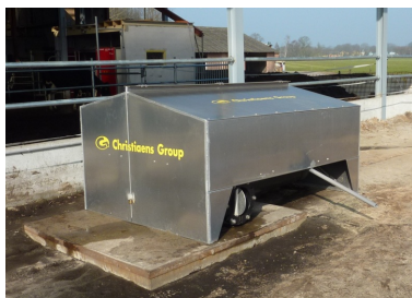
Teknikkasse med blæser og ventilsystem til udsugning og indblæsning. Rørene, som de er, indstøbt i bunden af komposteringsmåtten.