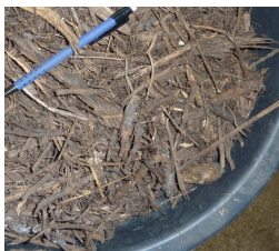
Lidt grovere flis.