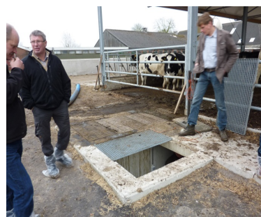
Blæsere og fordelingsrør er placeret i en underjordisk gang langs den ene gavl. Nedgang til underjordisk gang med indblæsningsudstyr.