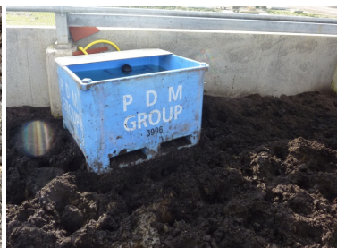
Vandkarrene er mobile, men der bliver alligevel oprådt omkring dem.