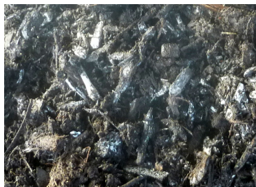
Nedbrydningsprocesserne resulterer i, at flisen som her bliver hvid at se på (foto fra bunken af isoleret kompost).