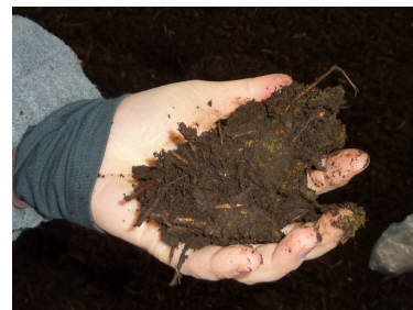
Supplerende flis påfyldes fra denne asfalterede vej bag stalden, derved undgås at køre på måtten. Komposteringsmaterialet var lidt klægt.