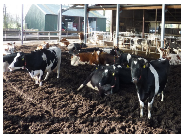
Køerne ligger komfortabelt på kompostmåtten, omend de var lang tid om at lægge sig.