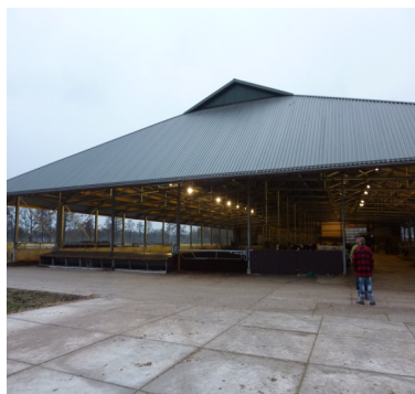
Meindert Wiersma – Hollandsk mælkeproducent. En velfungerende komposteringsstald i Holland.