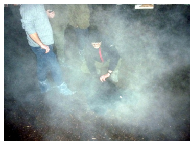
Der blev målt 0,5 ppm NH 3 , i dampen fra komposten umiddelbart efter fræsning. Dampen efter fræseren lugtede lidt af NH 3 .