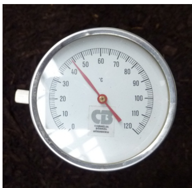
Måling i omsætningslaget: 44 °C.