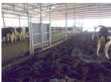
Mange låger mellem ædepladsen og komposteringsarealet giver mulighed for at flytte køernes overgang til komposten, og dermed på skift. skåne belastede områder.