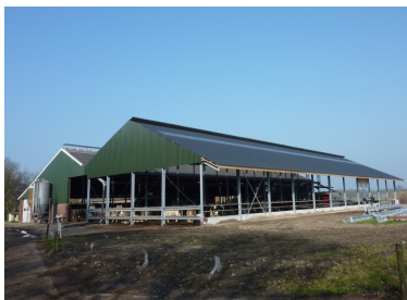
Stalden har én åben langside, samt to åbne gavle hvor kun gavltrekanten er lukket.