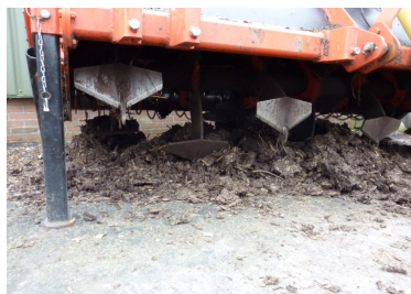
Fræser til bearbejdning af komposteringsmåtten. Denne maskine kan skovle komposten rund.