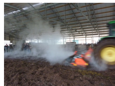
Propellerne danner luftstrømme, som suger dampen opad og ud af stalden.