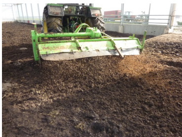
Ved fræsning to gange dagligt, indarbejdes gødningsklatterne i komposten.