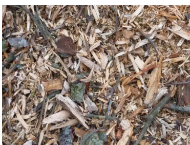
Flis klar til supplerig, hvis/når det bliver nødvendigt. Nærbillede af supplerende flis.