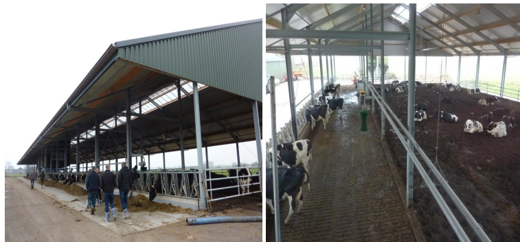
Udvendigt foderbord i hele staldens længde, kun afbrudt af AMS og servicenum i midten.

Der er adgang mellem ædeplads og komposteringsarealet flere steder. Inventaret mellem ædeplads og hvileareal består af mange låger, så adgangene flyttes jævnlgt, og kan i princippet være i hele ædepladsens længde.