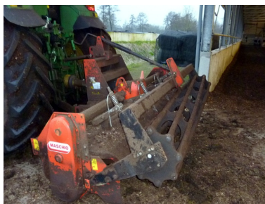
Fræseren, der anvendes til fræsning i 35 cm dybde. Ved fræsning tilføres ilt til kompostens aerobe nedbrydningsprocesser.