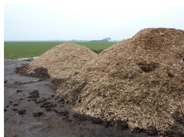
Der ligger altid flis klar, hvis der pludselig bliver behov for supplerende påfyldning.