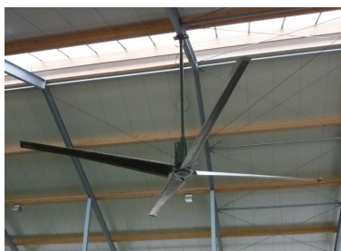
Vandret ventilator propel i loftet. Der var 3 stk. i den 100 meter lange stald.