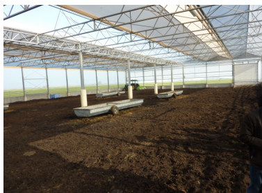
Så er der klar til fræsning, udfodring og flytning af de mobile foderkummer.