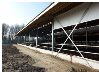
Stalden var helt åben i den langside, der ligger modsat foderbordet.